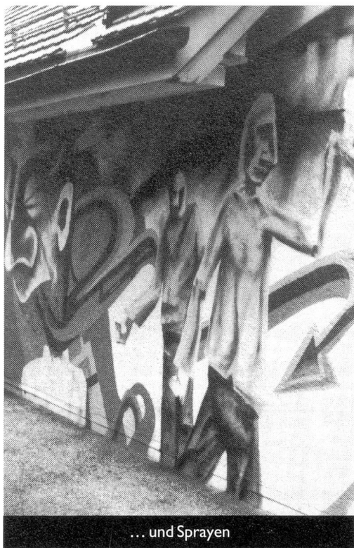
... und Sprayen

geht noch weiter: "Das ist unsere Religion. Wir sind Atheisten, das gehört bei uns dazu!" Sie würden einzig an den technischen Fortschritt glauben: "Er hilft einem, sich zu entfalten." Sie geben mir ein Bei-