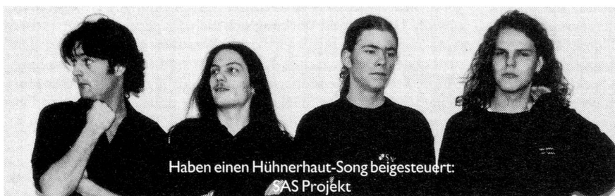
Haben einen Hühnerhaut-Song beigesteuert: SAS Projekt

Damit würden ca. zehn weitere Ostschweizer Rockgruppen, die bisher noch keine CD produziert haben, auf dem von jungen Bands geradezu mystifizierten Silberling erscheinen.