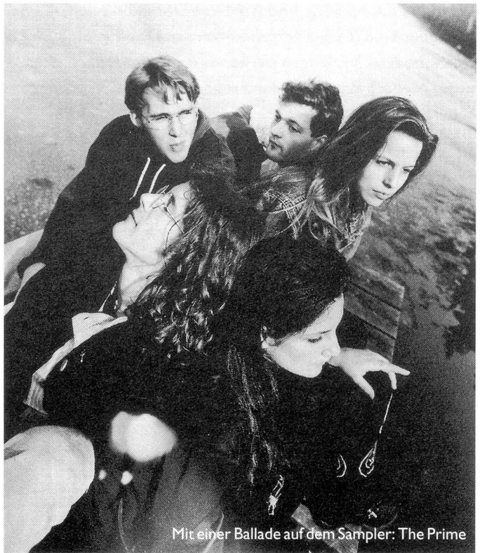
Mit einer Ballade auf dem Sampler: The Prime