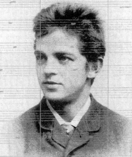
Carl Nielsen in jungen Jahren vor dem Handschrift-Manuskript von der Sinfonie «Das Unauslöschliche»

Den ausgedehntesten, dritten Satz des Quintetts, eine kunstvolle Folge von Variationen mit wechselndem Instrumentarium, kommentiert der Komponist (in seiner üblichen zurückhaltenden Art, in welcher er von sich selbst in der dritten Person spricht!): «Hier war der Komponist bestrebt, die Charaktere der verschiedenen Instrumente wiederzugeben. Hier plaudert gleichzeitig jeder mit jedem, da spricht jeder für sich selbst. Das Thema dieser Variation ist eine von C.N.'s eigenen Hymnen, und sie bildet hier die Basis zu einer Reihe von fröhlichen, barocken, elegischen oder ernsten Variationen, die im Thema mit all seiner Einfachheit und stilvollstem Ausdruck kulminieren.»