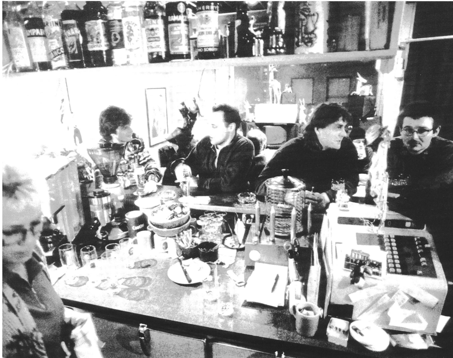
Was den «Hirschen» ausmacht: die kleinen Tischchen mit ihren südamerikanisch gewobenen Tüchern und ihren Melkstühlchen; die heruntergehängte Decke; der Ofen und der Rauchvernichter und die Marionetten à la Puppenstube.