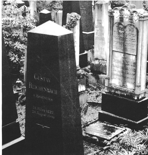
Der alte jüdische Friedhof an der Hagenbuchstrasse, St.Gallen

Mir ist in jüdischen Friedhöfen aufgefallen, dass Besucher jeweils kleine Steinchen auf