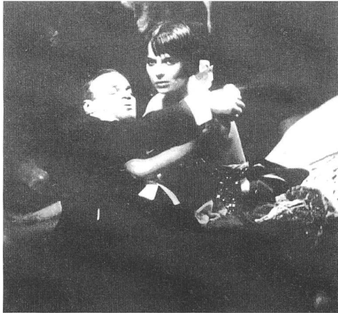
Louise Brooks als "Lulu" in der Verfilmung von "Pandora's Box" aus den 20er Jahren

totale sein; mit ihrer blossen Existenz beweist sie die Unsicherheit männlicher Herrschaft immer wieder neu. Lulu und Carmen gelten beide als Inkarnationen selbstbestimmter Sinnlichkeit. Diese Sinnlichkeit macht sie zwar ausbeutbar, wie im Fall von Lulu, aber nicht manipulierbar. Die femme fatale tritt dem Mann als radikal Andersartige gegenüber, sie ist nicht seine narzistische