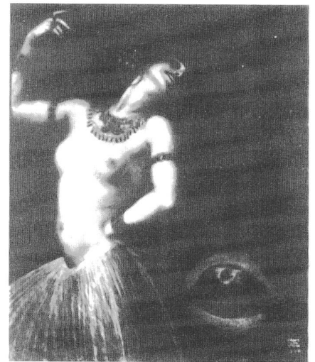
"Salome" von Franz von Stuck (1906)