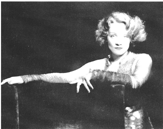
Marlene Dietrich im Jahre 1931