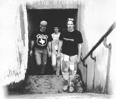
Mack & the Bluesflakes