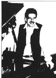
Martin Castelberg Klaviere und Flügel

Deine Ansprechpartner im Musik Hug St. Gallen