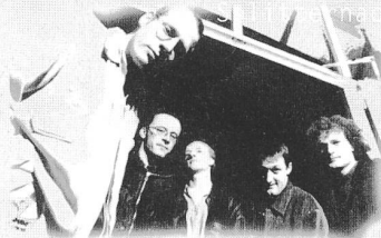
Das wilde Tiger Ensemble

3GG Akoustic Cover 19.00-20.00 Uhr Das wilde Tiger Ensemble aus St. Pauli 20.00-21.00 Uhr Rumble Fish Blues 22.00-23.00 Uhr