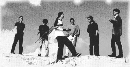
Das wilde Tiger Ensemble

Ilford Hip Hop 19.00-20.00 Uhr Mizan Acid 20.30-21.30 Uhr Splitternacht Deutsch Rap 22.00-23.00 Uhr