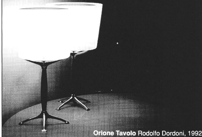
Orione Tavolo Rodolfo Dordoni, 1992