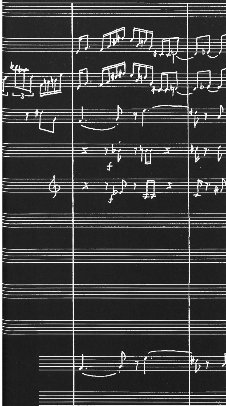
Ausschnitt: Canto für Kammerorchester (J.W. Goethe: Wandrers Nachtlied) 1994, 14'

druckt. Allan Petterson bewundert er für seine kompromisslose Subjektivität, Giacinto Scelsi wegen seinen Klangfarben und seiner Orchesterbehandlung und Peter Ruzicka wegen seinem Umgang mit der Tradition.