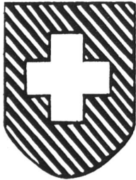
Städtemannschaft St. Gallen: Schwarze Hosen, weißer Trikot m. roter Garnitur

Erster Nachkriegsstart ausländischer Fußballgäste / Reingewinn für Münchner Waisenhaus-Fond