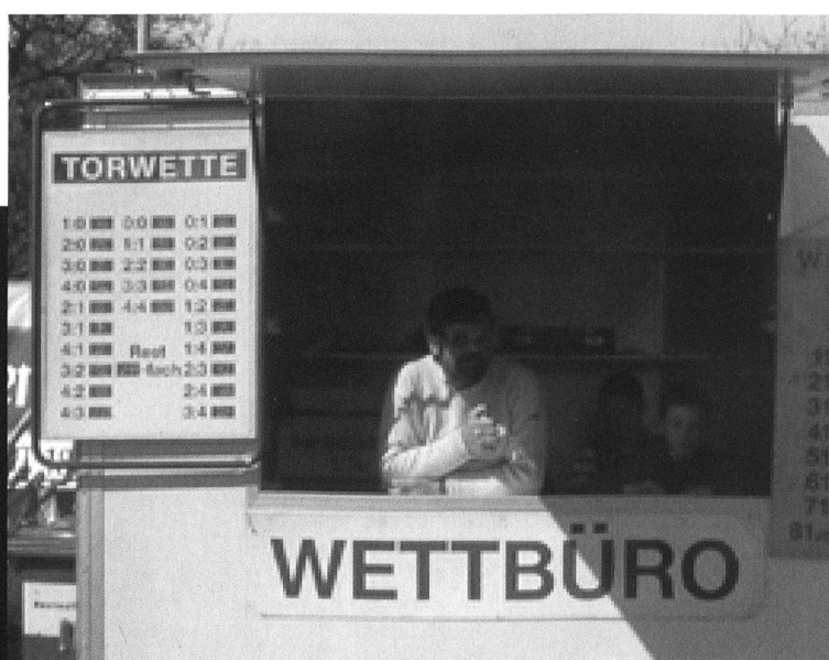
Wetten, dass Austria Lustenau am Ende doch nicht absteigt.