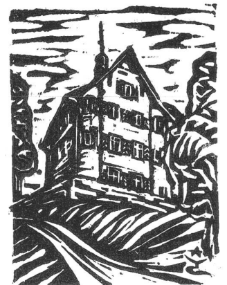
Grüne Katze auf Schloss Dottenwil, Wittenbach, 18. VI 99