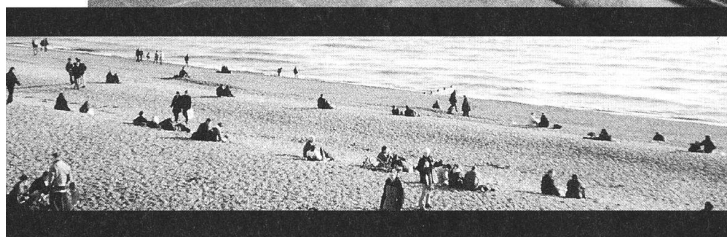
Schon riecht's nach Frühling: Mediterranes Klima in Südeingland