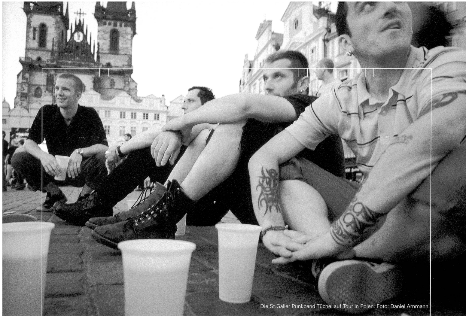
Die St. Galler Punkband Tüchel auf Tour in Polen.

die «Bridge Over Troubled Water» und heizen dann durch den «Tunnel Of Love», um schliesslich «In The Ghetto» ausgebrannt und ausgeschlachtet zu verrosten. Es lassen sich prima Top-5-Listen erstellen mit Songs, in denen die Strasse irgendwie vorkommt, aber mit diesem Ansatz landet man früher oder später dort, where the streets have no name. Klar, Kraftwerk haben mit «Autobahn» die Monotonie-Hymne schlechthin geschaffen, damit allerdings auch den Begriff «Autobahn» im angelsächsischen Raum dermassen gut montiert, dass sich im Coen/Coen-Film «The Big Lebowski» gar eine nihilistische Band gleichen Namens mit dem Album «Nagelbrett» einschmuggeln durfte. Der oberflächliche Zusammenhang zwischen Strasse und Populärmusik kann demnach ziemlich einfach aufgezeigt werden.