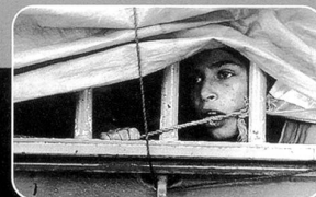
a time for drunken horses