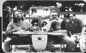
the big lebowski