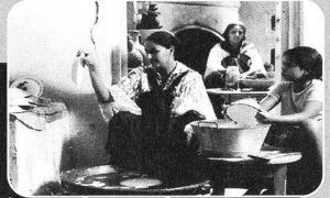
la saison des hommes