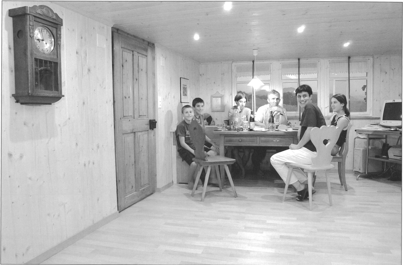
Lebensraum im Alltag: Nebenstube und Küche.

läuft – Tiere krank sind – , dann ist auch die Stimmung im Haus schlecht.» Ohne Mithilfe der ganzen Familie ist es für die Kleinbauern sowieso gelaufen. Neben dem Bauernhof als Kindergärtnerin arbeiten? – «Nein, jetzt nicht, ich brauche die Nähe zur Familie, zu den Tieren und Pflanzen.»