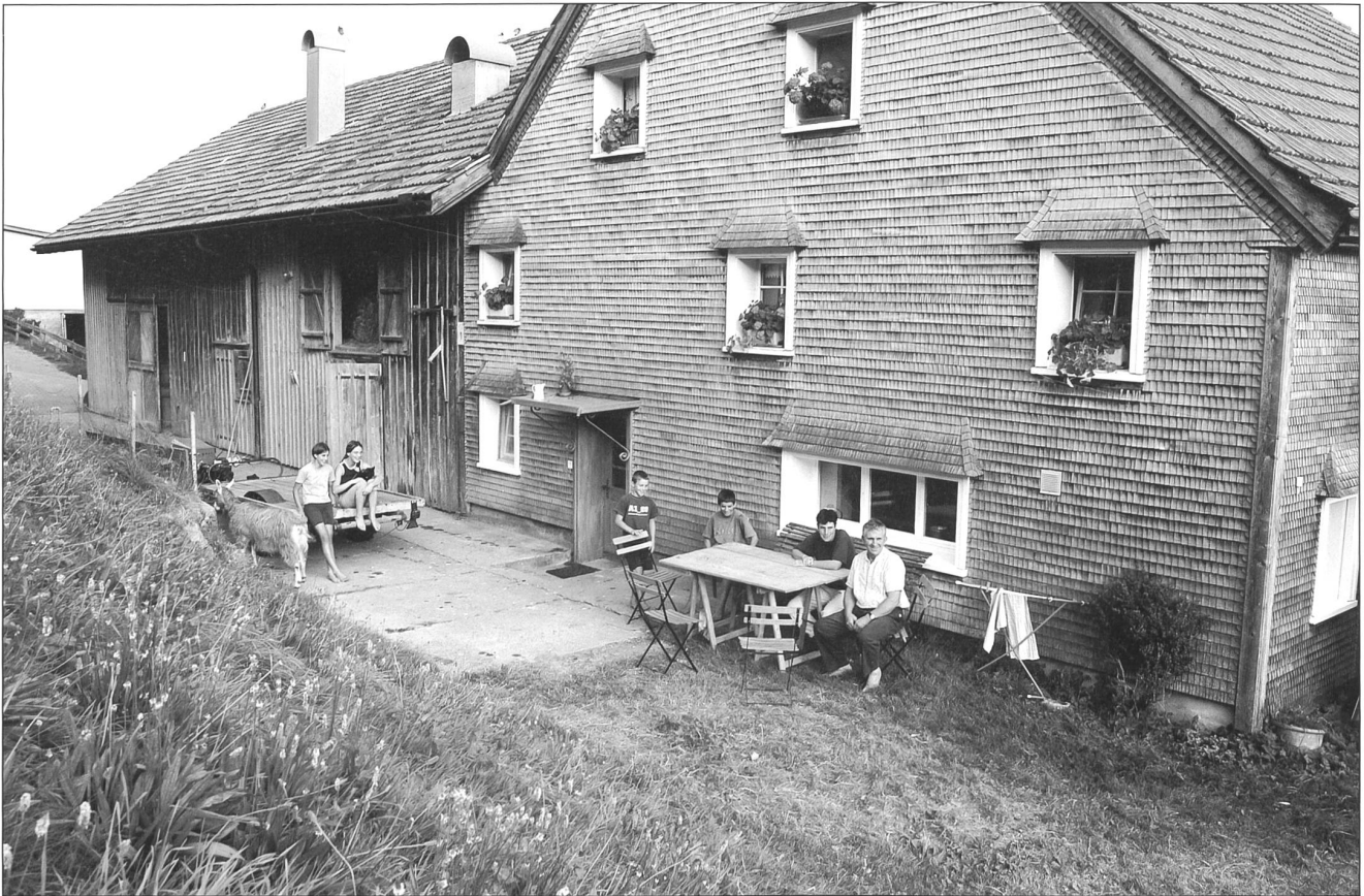
Feierabend: Familie Brunner vor dem Katzenloch.

wie vor fünfzig Jahren leben...?» 21. Jahrhundert in der Küche, 19. Jahrhundert unter dem Dach. Ein Gang durch das Bauernhaus ist auch eine Reise durch die Geschichte des bäuerlichen Wohnens: Der Estrich ist nicht von der Wohnung abgetrennt. Im offenen Raum unter Holzschindeln hängt Wäsche. Ein Gang führt zum Taubenschlag und zur ehemaligen Räucherammer. Die Kinderzimmer sind ungeheizt, mit rohen Holzbalken als Wänden, geschmückt mit Postern von Fussball-Stars und Tieren. Es ist praktisch und nüchtern, so wie Räume eben sind, die man früher nur zum Schlafen brauchte. Felicitas Brunner zeigt auf einen Holzschnitt im Schlafzimmer. Ein Mann mit bäurischen Gesichtszügen und eine liegende Frau. «Ein altes Geschenk von einem befreundeten Künstler. Es passt hierher.» Wenn es richtig kalt wird im Winter, schleichen die Kinder hinunter zum Kachelofen in der Schönen Stube, ziehen an der Wärme das Pyjama an, schnappen sich eine Bettflasche und kriechen mit einem Buch unter die Bettdecke. Das Herz des Hauses? – Im Winter einfach dort, wo es warm ist.