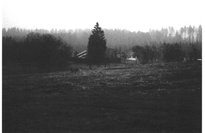
Ornes (Frankreich), 6 Einwohner