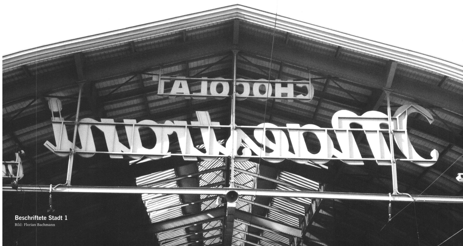
Beschriftete Stadt 1