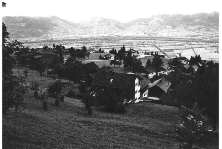
Planken (Fürstentum Lichtenstein), 365 Einwohner