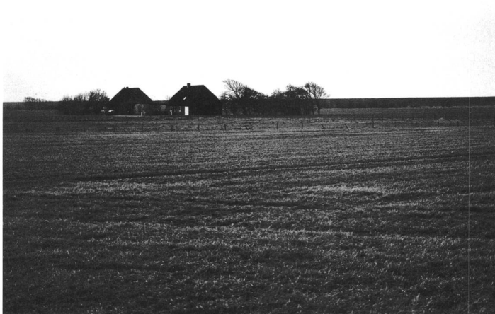
Reussenköge (Deutschland), 362 Einwohner