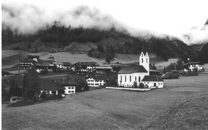
Gramais (Oesterreich), 53 Einwohner

«Eine Stunde Lebenszeit» hiess 1999/2000 ein erstes Projekt. In Berlin, St.Gallen und Kreuzlingen zogen sie mit dem Leiterwagen los und filmten 99 Leute bei ihren Tätigkeiten: Blumengiessen, Treppenwischen, Handorgelspielen. Weil die Handlung genau dokumentiert sein wollte, mussten die Passanten mithelfen – sogenannte Setmannschaften wurden gebildet. 2001/2002 folgten «Videoszenen», darin winken sich einander unbekannte Menschen freundlich zu. Wenig später wurde «Freunde &