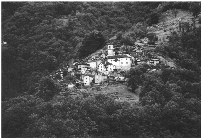
Corippo (Schweiz), 22 Einwohner

hindert, dass die Protagonisten zu blossen Darstellern wurden, im Gegenteil: Die Einladung hat in jedes Dorf Bewegung gebracht. Der italienische Gemeindepräsident lud seine Frau zum ersten Mal an ein Essen mit dem gesamten Gemeinderat ein. Der Deutsche wiederum – seine Gemeinde setzt auf Windenergie – denkt fortschrittlich und hat einige Ideen für die sechs Gemeinden versprochen. «Es muss überhaupt nichts beschlossen werden am Treffen», sagt Patrik, «aber dass im Treffen der Kleinsten einiges an Potential steckt, liegt auf der Hand.»