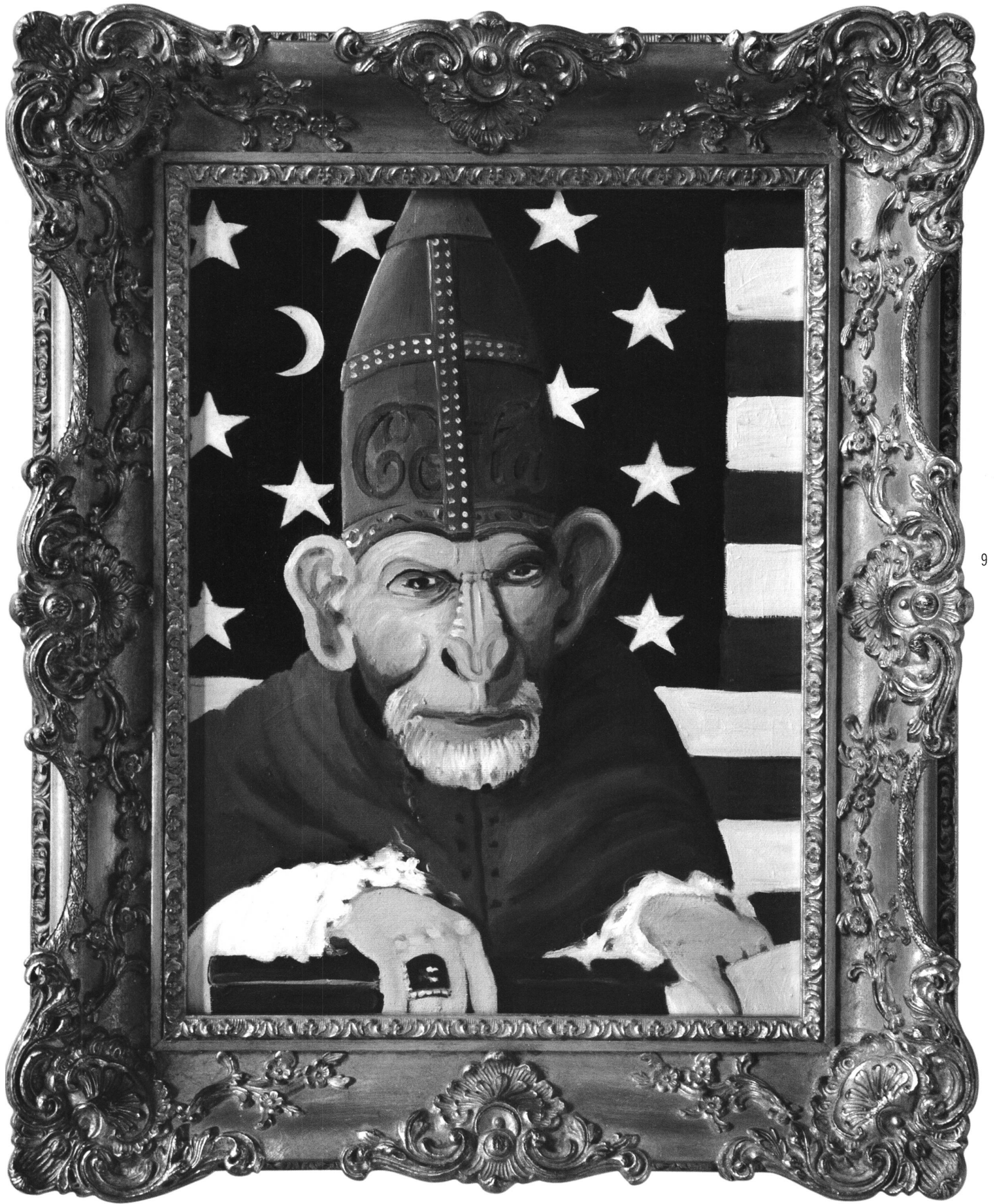
Weltpräsident, Öl auf Leinwand, Josef Felix Müller, 2004