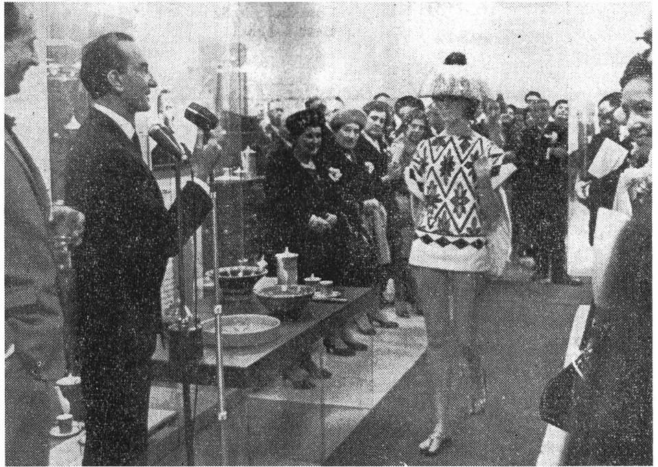
Noch eine Demonstration der modernen Welt: Der italienische Modeschöpfer Emilio Pucci präsentiert seine neueste Kollektion anlässlich der Eröffnung des Neumarktes 1. Bild aus der Ostschweiz vom 21. März 1963.

In wirtschaftlicher Hinsicht ist der Neumarkt bis heute eine Erfolgsgeschichte. Fast vergessen jedoch und unter der alltäglich-praktischen Benutzung vergraben ist seine Bedeutung als städtebaulicher und mentaler Wendepunkt in der St.Galler Stadtgeschichte. So sehr hat man sich an den «siebten Himmel der Einkaufsfreuden» gewöhnt, dass die eigentlich monumentale Grösse der Anlage quasi unsichtbar geworden ist. Eher noch nimmt man den Wechsel der Geschäfte wahr – ein Prozess, durch den sich das Einkaufszentrum ständig erneuert und verändert. Mit der gleichen Nostalgie wie bei der wirklichen Stadt erinnern sich die Stadtbewohner an das Vergangene, das dem Neuen Platz gemacht hat: An den ersten Pick Pay im Untergeschoss, der die Kunden durch ein schlangenartiges Regalsystem in Ein-Weg-Richtung geschleust hat, an das einstmals mondäne Modeverkaufshaus Spengler, an das Cafe Bajazzo, das von seinem eigenen Betreiber in Brand gesteckt wurde, oder an die sechseckigen Sitzbänke in der 1. Etage des Neumarkt 1, die wohl im Hinblick auf den Wegweisungsartikel schon vor Jahren präventiv entfernt wurden. Andere Dinge ändern sich nie. Die Migros ist seit dem ersten Tag der grösste Mieter: Die Lebensmittelabteilung verbindet unterirdisch Neumarkt 1 und 3, das Migros-Restaurant im ersten Stock