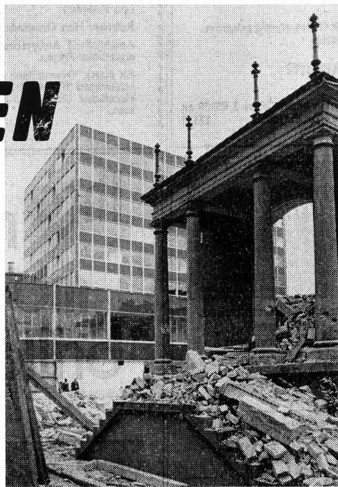
Die St.-Leonhard-Strasse vor der Errichtung des Neumarkts 2. «Ein Sinnbild für unsere lebendige, zukunftsreiche Stadt, in der das Alte Neuem Platz macht, nicht ohne – wie man sieht – beim Untergehen eine fast imposant anmutende Würde an den Tag zu legen.» Bild und Text von der Ostschweiz vom 22. April 1964.

Der «Gläserne Würfel auf stählernen Stützen» wird zum kalendrischen Frühlingbeginn 1963 als Einkaufszentrum Neumarkt 1 feierlich eingeweiht. Genauso ungewohnt wie die Grösse der Baustelle und der massenhafte Einsatz von Gastarbeitern ist in den frühen sechziger Jahren die Bündelung verschiedener Einkaufsmöglichkeiten unter einem Dach. Fasziniert berichtet die «Ostschweiz»: «Die Rolltreppe vom Supermarkt im Parterre hinauf zu den