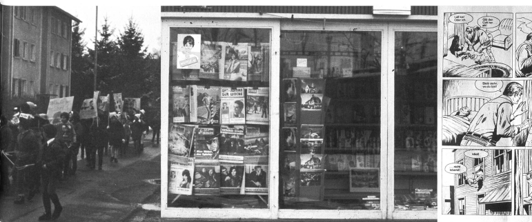
Primarklasse Tobler trägt die Schundhexe zum Scheiterhaufen, das Dorf lässt es kalt. Bilder aus einem Diavortrag gegen den Schund. Foto: Max Tobler, 1965

stand: «Dass in der heutigen Jugend immer wieder auch ein Geist der sauberen Haltung, der aufbauenden Arbeit und Disziplin waltet, belegt die originelle Aktion einer Romanshoner Schulklasse, die beschlossen hat, König Schund den Kampf anzusagen.» Der Schund wurde verbrannt. König Schund liess es kalt, die Dorfbevölkerung ebenfalls, und Max Tobler notierte sein neues Ziel: «Am 1. August 100 Schulen in der ganzen Schweiz, die dasselbe tun.» Ein Kassabuch wurde eröffnet. Erste Einlage im Kampf gegen die Milliardenindustrie: 190 Franken. Die Sache kam ins Rollen, im Grossen wie im Kleinen. Frau Hugentobler läutete bei Toblers an und bat um einen Aufsatz gegen den Ausverkauf der Heimat durch deutsche Illustrierte, und die Schweizerische «Caritas» erklärte sich bereit, sich am Vorhaben zu beteiligen. «Wir möchten uns dem mutigen Beginn anschliessen. Wäre es