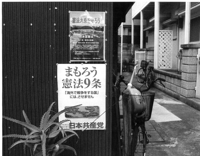
Überall in Kyoto hängen Plakate der kommunistischen Partei, die sich gegen die Abschaffung des Artikels 9 der japanischen Verfassung ausspricht. Der Text lautet: «Bewahren wir den Artikel 9 – Lassen wir uns nicht zu einer Nation werden, die im Ausland Krieg macht.»