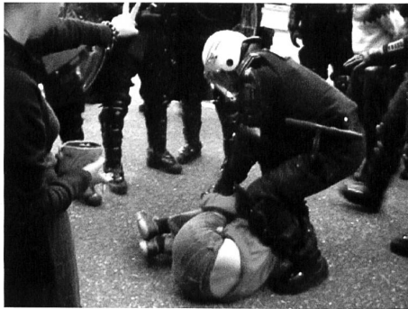
Fünf Tage nach der Abstimmung zeigte die Polizei mit einem Grossaufgebot gegen 150 Demonstranten, was sie unter dem Begriff «Verhältnismässigkeit» versteht.