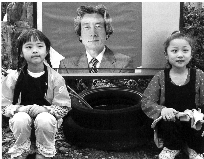
Eine graue Mähne macht noch keinen Reformen. Japans Kinder blicken in eine düstere Zukunft.