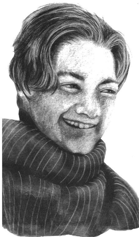
Illustration: Lika Nüssli

Die Geschichte eines Pflegekindes. Chronos Verlag, Zürich 2006.