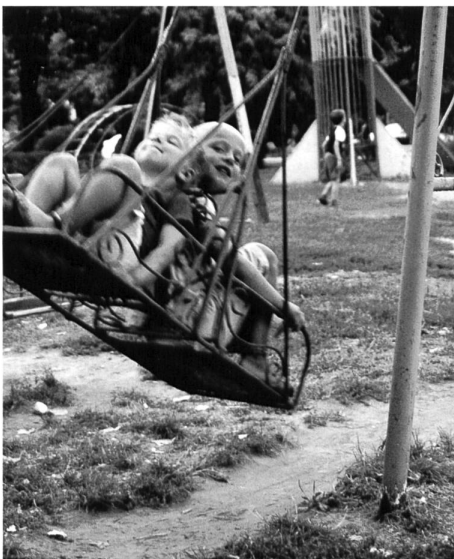
Nicht euronormiert, sondern rege genutzt: Spielplatz in Vidin.