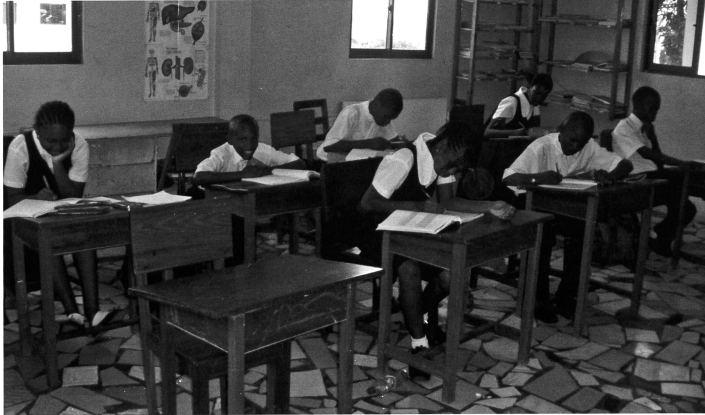
An der Privatschule Queen's International sind die Klassen überschaubar.