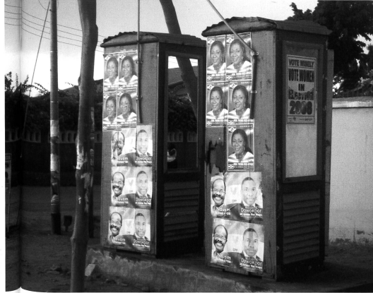
Wahlkampfpakete in Ghana: alle versprechen eine rosige Zukunft.