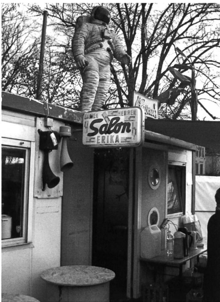
Bilder: Daniel Kehl