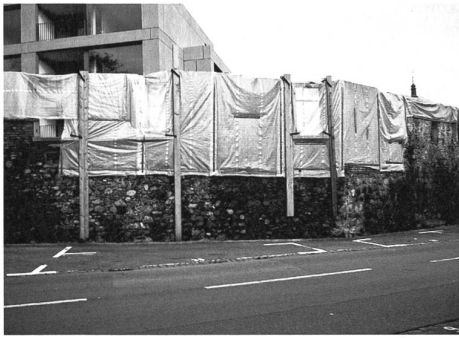
Denkmalpflege in Altstätten.

Stadtmauern waren einst der Inbegriff einer Stadt. Sie waren Symbol: «Hier Stadt, dort Land». Zuerst der militärischen Verteidigung, dann der sozialen Kontrolle dienend, waren sie im 19. Jahrhundert im Weg. Zuerst wurden sie durchlöchert, dann abgetragen. Erst viel später kam die Phase der Wertschätzung. Die kümmerlichen Reste von Stadtmauern, die es heute es noch gibt, gelten als wertvolle Zeugen und vermitteln einen willkommenen Hauch von Geschichte. In Altstätten hat sich gegen das Ap-