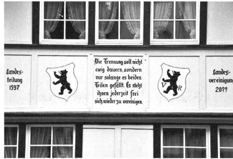
Das alles verändernde Sprüchli prangt seit 1997 an der Hausfassade in Trogen.

So merkten die zerstrittenen Hälften allmählich, dass via appenzell.ch und appenzellerland.ch eigentlich die gleichen Inhalte in die weite Welt hinausgeschickt wurden, und sie gaben sich einen Schupf: «Die Trennung soll nicht