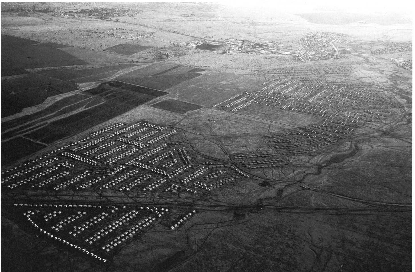
Familienquartier der Minenarbeiter in Rustenburg.

ist Historiker und war Aktivist der Anti-Apartheid-Bewegung in St.Gallen.