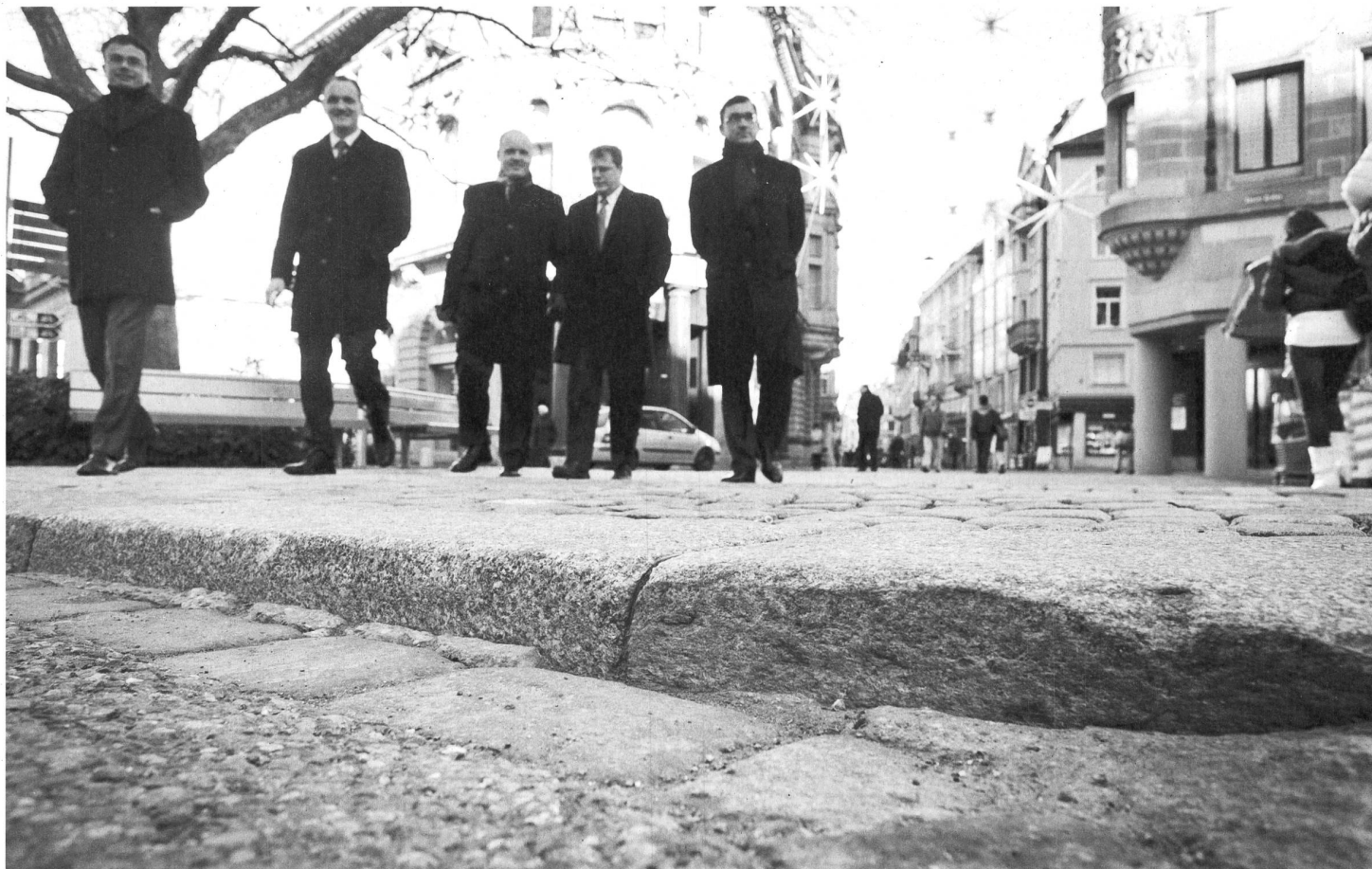
Schön, aber hinderlich: Pflastersteine und Schwellen.

Bei der Stadtpolizei ist zu erfahren, dass bei Behindertenparkplätzen verschiedene Reglemente gelten; je nachdem, ob es sich um öffentliche, halböffentliche oder eben private Parkplätze wie bei der AFG-Arena handelt. Im letzteren Fall gelte das Reglement der Betreiber. Bei öffentlichen Abstellplätzen hingegen werde Falschparken streng gebüsst.