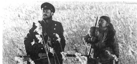
Manche Leute brauchen Bücher, wie Dersu Uzala die Taiga zum Überleben.

Verena Schoch , 1957, ist Kamerafrau und Fotografin und wohnt in Waldstatt.