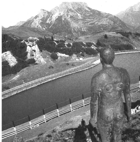
Ein Leserbriefschreiber wittert hier sexuelle Belästigung.

Die bisher veröffentlichten Leserbriefe und Postings boten hauptsächlich die in diesen Spalten üblichen Bizarrerien bis hin zu einem Schreiben, das sich gegen die «Sexfiguren» aussprach (was die Frage aufwirft, wie notgeil jemand sein muss, um eine stilisierte rostige Eisenfigur für sexuell anregend zu halten – stimulierend natürlich immer nur für andere, nämlich für die Frauen, die nach Ansicht des Briefschreibers wegen der «Nackten» sofort zu Bergtouren aufbrechen).