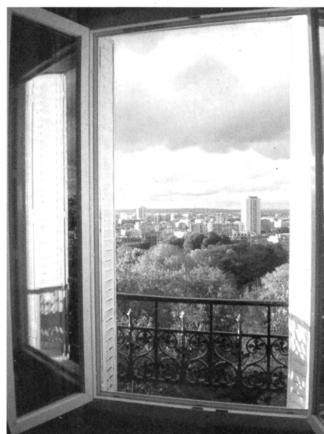
Ausblick aus der Studentenwohnung auf die Vororte St. Denis und La Courneuve.