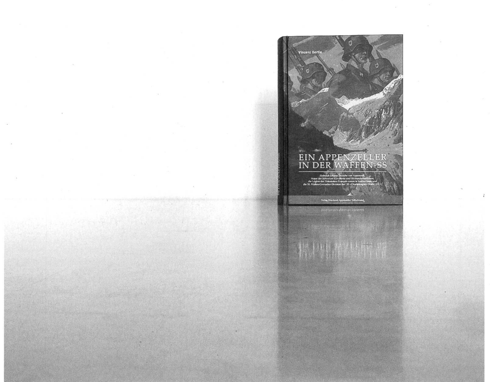
Wandert auf dünnem Eis: das neueste Werk von Vincenz Oertle.

Das erste Buch, mit dem er von sich reden machte, erschien 1997 und trug den Titel «Sollte ich aus Deutschland nicht zurückkehren ... Schweizer Freiwillige an deutscher Seite 1939–1945». Es handelte von jenen Schweizern, die im Zweiten Weltkrieg ins Dritte Reich überliefen und sich dort als Freiwillige dem Führer zur Verfügung stellten. Für solche braune Eidgenossen gab es in Stuttgart eine spezielle Empfangsstelle, das so genannte «Panoramaheim». Von dort aus wurde die Nazi-