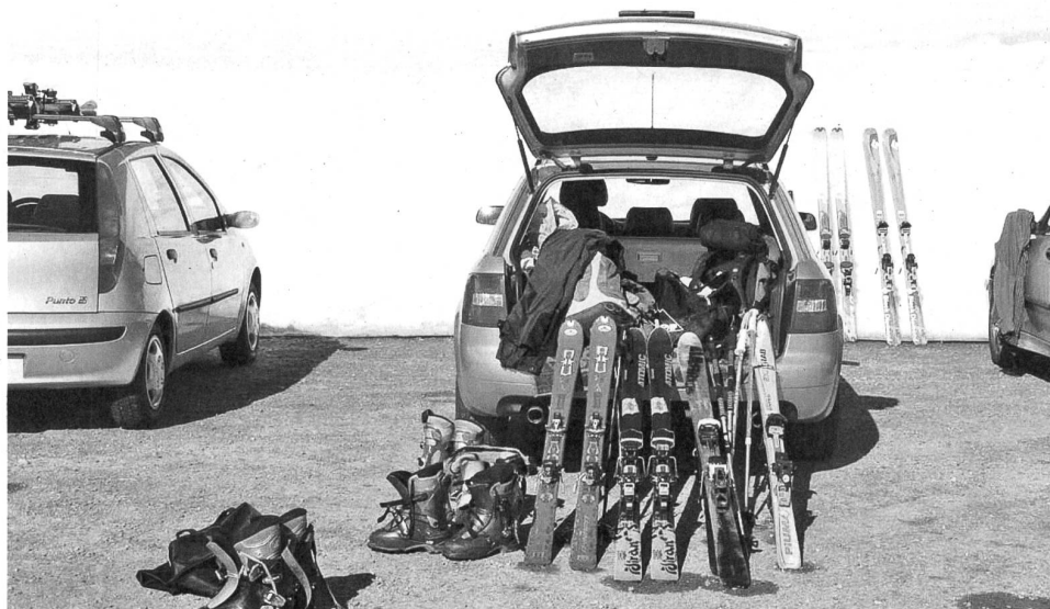
Tagestouristen ziehen das Staustehen mit Sack und Pack einer Hotelübernachtung vor. Das soll sich nun im Toggenburg ändern.

Der subkulturelle Aufbruch der achtziger Jahre hat auch in Schaffhausen Fanzines hervorgebracht. Eines davon, das «Tap-Blatt», hätte zu