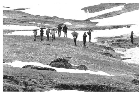
Die Künstler wurden auf der Alp Sellamatt gehörig verschifft.

Eine Installation solarer Art gibt es auch ein paar Kilometer weiter unten im Tal. Unter dem Logo Energietal Toggenburg wird zum dritten Mal der Tag der Sonne installiert. Dieser ist in den letzten Jahren zu einem wichtigen Event innerhalb der Projektgruppe Energietal