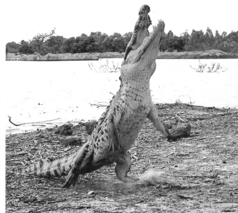
Hohe Schule der Availability: Ein Alligator zeigt Präsenz.

In Zürich sprach Gumbrecht diesmal über Availability, die Allverfügbarkeit im digitalen Medien-Setup (Internet, Personal Computer, Smartphone et cetera), und stellte die Frage, ob man sich der elektronischen Revolution anpassen könne. Die Antwort: Man kann nicht anders – ausser man gehört zu einer Sorte Mensch, wie sie in Anekdoten vom einfachen