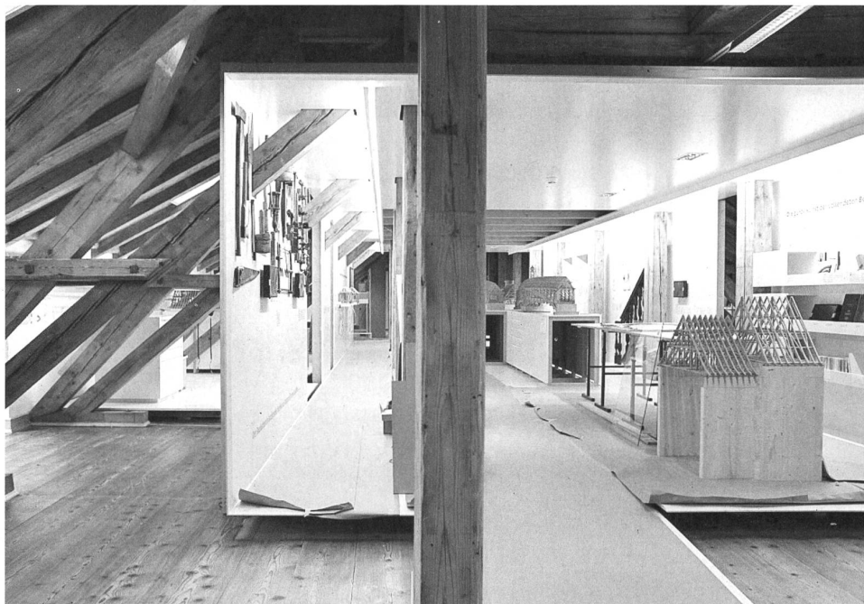
Dachstockmodell im Dachstock: Die neue Grubenmann-Sammlung im Aufbau.