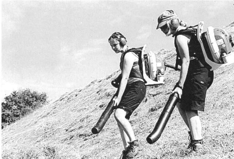
Artfremde Wesen nehmen die Hügel ein.