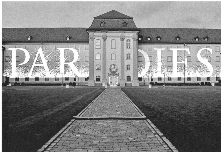
Schülerarbeit «1400 Sekunden Gallus» – jetzt will der Kanton ausgerechnet bei der Bildung sparen.