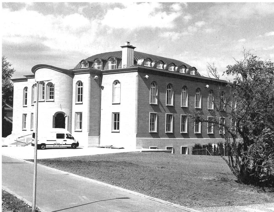
Renaissance, verkehrt herum: der Modelhof.