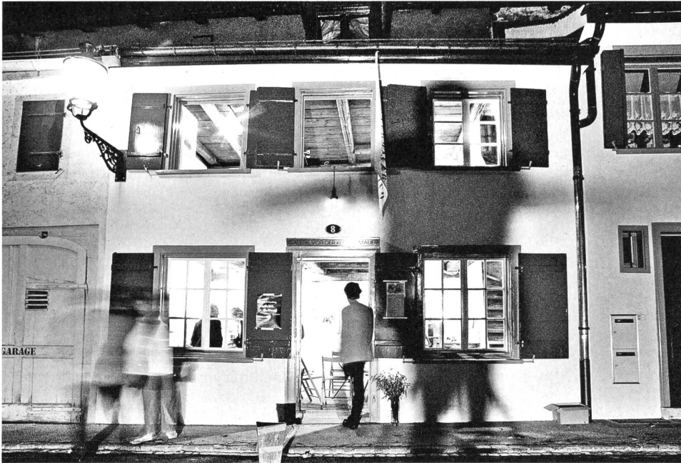
Kunst-Lichtblicke seit 45 Jahren: die Galerie vor der Klostermauer.