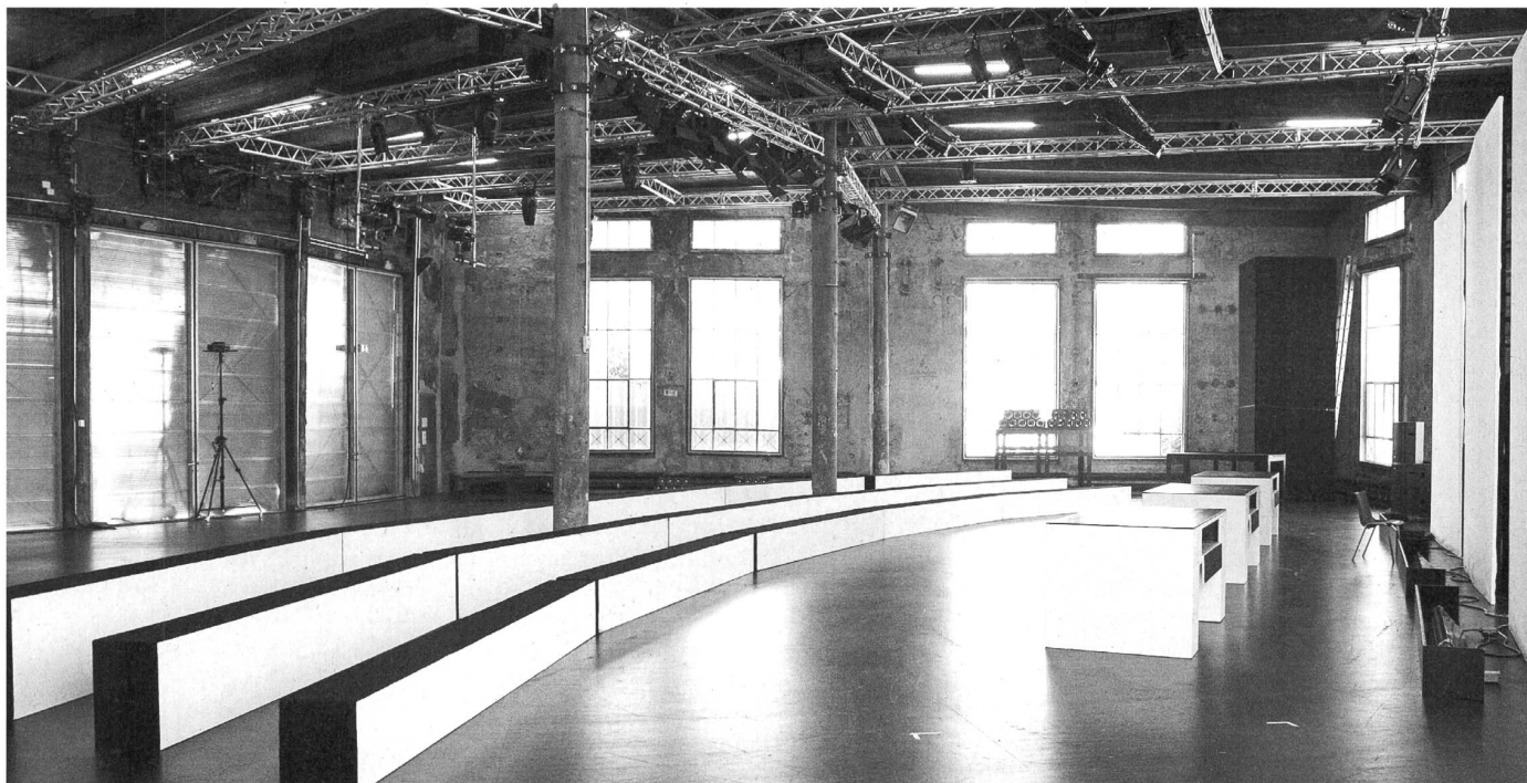
Begehrt: Der grosse Theatersaal, hier eingerichtet für «Homo Faber» des Theaters St.Gallen.

«Ein wahnsinnig schöner und herausfordernder Raum». So umschreibt Dodó Deér die umgebaute Lokremise. Hier im Theatersaal 1 hat er letzten Sommer die Open-Opera-Produktion «Rüdisüli in der Oper» inszeniert, in einem käfigartigen Spielrund, vor ausverkauften Reihen. Die Betreuung vonseiten der Lokre-