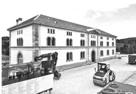
Umgenutzt: das Zeughaus Teufen.

Das Zeughaus Teufen ist renoviert, das Zeughaus Ebnet in Herisau wird renoviert: Zeughäuser sind im Trend. Mindestens in Appenzell Ausserrhoden. «Das Gebäude ist schön, bequem und dauerhaft, und beweist den noch blühenden Freiheitssinn unserer Obrigkeit und unsers Volkes: denn wo man keine Anstrengungen scheut, die Hilfsmittel zur Beschützung und Erhaltung der Freiheit anzuschaffen, da wird man dieselben auch zur rechten Zeit zu gebrauchen wissen», heisst es 1825 zum neu erbauten Zeughaus Trogen. Hilfsmittel zur Beschützung und Erhaltung der Freiheit? «Zeug» hat nichts mit zeugen oder Zeugen zu tun, im Gegenteil: «Zeug» sind Geräte, sprich Waffen – Kriegsmaterial im weitesten Sinne. Ein volles Zeughaus bedeutet militärische Schlagkraft, bedeutet Abschreckung