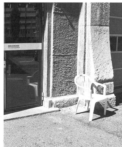
Verwehrt: Nicht alle schaffen es in die Lokremise.