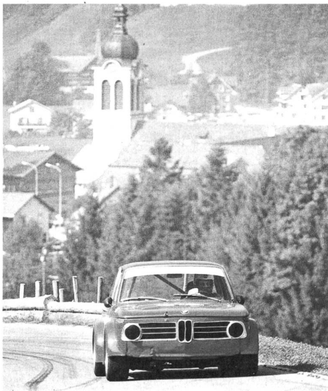
Das legendäre Hemberger Bergrennen lebt diesen Spätsommer wieder auf.

Das Restaurant liegt direkt an der Hauptstrasse. Ein schöner Gartensitzplatz unter Platanen mit schönen Holztischen und gemütlichen Stühlen lädt auch an weniger sonnigen Tagen zum Verweilen ein. Ein grosser Pizzaofen liefert