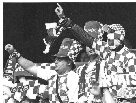
Hrvatska! Kroatische Fans am Feiern.

So verbrachte ich denn das erste EM-Wochenende im «Kastanienbaum» und sah von Spiel zu Spiel meine Chancen schwinden, wenigstens den Tipp und somit ein bisschen Geld, das ich während der EM versoffen haben werde, zu gewinnen. Kaum verwunderlich – oder: erwartbar –, denn in Wirklichkeit finde ich natürlich nicht alle Mannschaften gleich blöd, sondern einige etwas weniger – Griechenland, Kroatien oder Schweden zum Beispiel oder anders gesagt: so ziemlich alle, denen Kenner kaum die grössten Siegeschancen einräumten. Mit Werners Stammpublikum, dessen Durchschnittsalter irgendwo kurz vor der Pensionierung liegt, fieberte ich, juchzte und heulte ich den Bildschirm an und war nicht mal böse, dass sie allesamt besser getippt hatten als ich, auch wenn allesamt auch besser verdienen als ich und teils etwas verkrustete Ansichten über die heutige Jugend breitschlagen und sich recht laut über lärmige, verkotzte Altstadtgassen echauffieren, während sie sich das zehnte Bier hinter die Binde schütten.