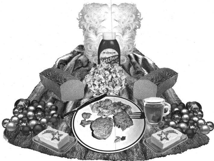
Illustration: Rahel Eisenring