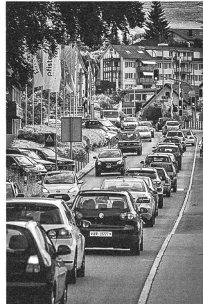
Alpsteinstrasse in Herisau, fotografiert von Daniel Ammann und fürs Cover bemalt von Lukas Schneeberger