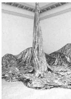
Heimspiel spektakulär: Mit Marbod Fritschs Installation «Easy Come Easy Go» (Cover) ergiesst sich ein goldener Wasserfall in den Oberlichtsaal des Kunstmuseums St. Gallen. Und Roland Adlassnig legt Österreichs Fahne über den Treppenaufgang: «Tu Felix Austria».