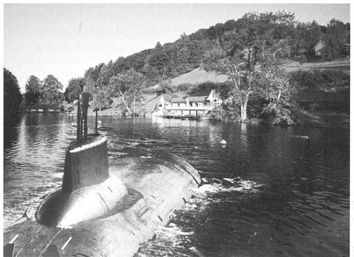
Bildmontage: Carol Pfenninger