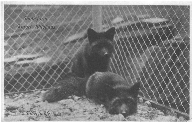
Postkarte 1931