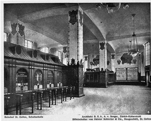
Bahnhof St. Gallen, Schalterhalle Architekt B. S. A. A. v. Senger, Zürich-Kaisertal Billetschalter von Hektor Schätter & Cie., Baugeschäft, St. Gallen