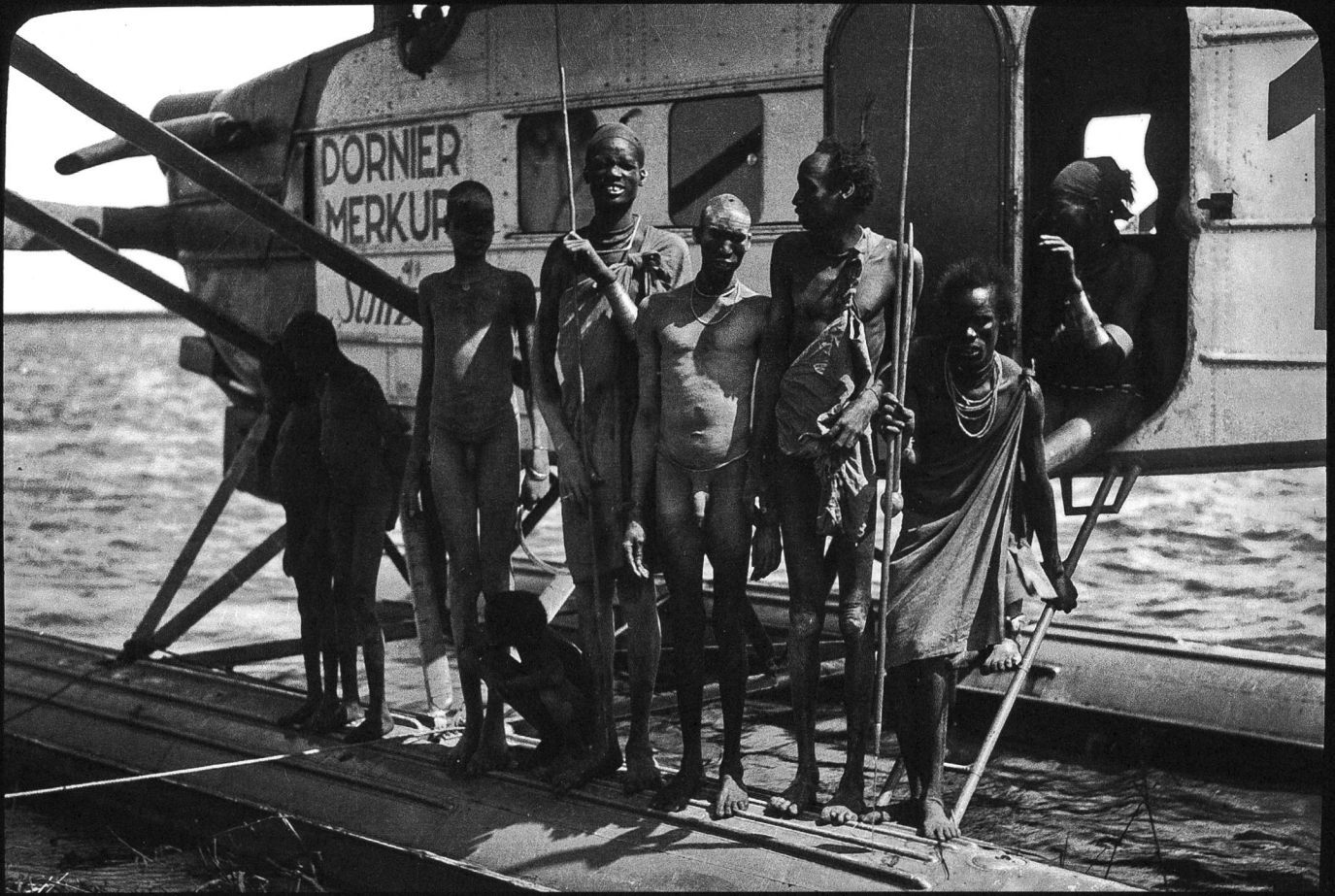
Nach der Landung bei Abwong am Sobatfluss. Die Dinka-Neger haben sich vom ersten Schrecken erholt. Afrikaflug, 1927