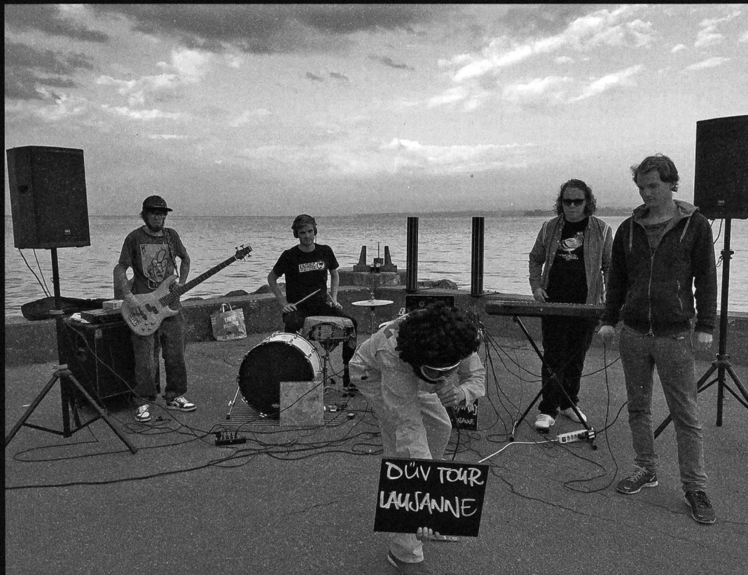
Zum Znüni in Lausanne: die üblichen Verdächtigen.

Ham-E und E.S.I.K. haben eine EP gemacht, Schuldig und verdächtig heisst sie. Gefeierte wurde das mit einer ambitionierten Schweizerreise: zehn Konzerte in zehn Städten. Alles an einem Tag. von Corinne Riedener