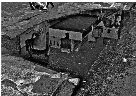
Lafayette between Jersey & Houston (Ahmad Jamal)

Billy Strayhorn (1), Ahmad Jamal (2), Billy Higgins (3).