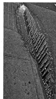
LaGuardia & West 3rd (Billy Higgins)