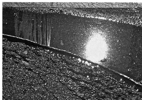
Chambers & Broadway (Billy Strayhorn)