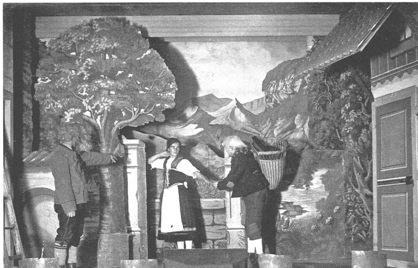
Bild: «s'Nullerl. Andwil 1923 – TG», Abendunterhaltung des Turnvereins Heimenhofen (Archiv Stefan Keller)

Der jüngere Grossvater, ein Bauer, klettert über die Körper seiner Kameraden bis zur Spitze der Turnerpyramide und steht plötzlich zuoberst zwischen den Dachbalken auf den Schultern so vieler Männer: etwas klein gewachsen, aber topfit. Der ältere Grossvater, Fabrikant und Ortsvorsteher, sitzt im Publikum, trinkt Bier, raucht Zigarillos der Marke Toscani, lacht zum Tischnachbarn und weiss nicht, dass er mit dem Burschen auf der Pyramide einmal gemeinsame Enkel haben wird.