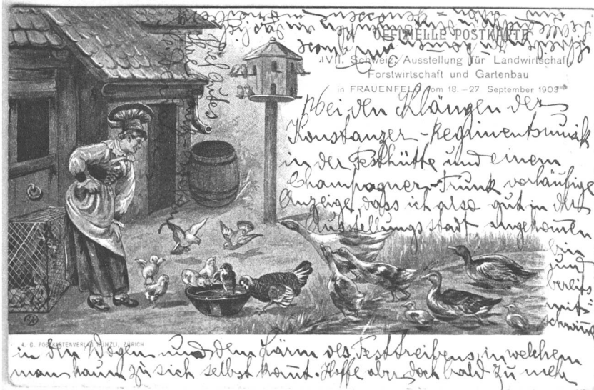
Archiv Stefan Keller

In der Zeit, als die Schweizer Trachten erfunden wurden, hatten Gewerbe- und Industrieausstellungen die Schützenfeste als Ort der vaterländischen Selbstdarstellung bereits abgelöst. Die Landwirtschaft wollte ebenfalls dabei sein, und zwar im allerbesten Kleide. Doch seit dem Untergang der alten Eidgenossen war die hiesige Mode ganz durcheinander geraten. Selbst konservative Bäuerinnen trugen lieber republikanische Baumwollröcke nach Pariser Art als die bretharten Fisch-