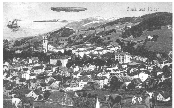
Mit dem Zeppelin über das Expo-Land – im Jahre 1911.