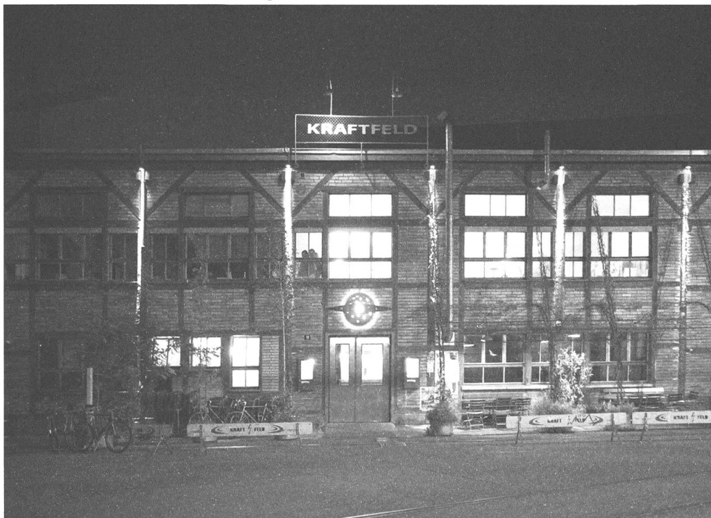
Kraftfeld Winterthur bei Nacht.

«Polickeywissenschaft» hiess ab dem 18. Jahrhundert die Lehre von der guten Verwaltung eines Gemeinwesens. Aus der Zentralperspektive einer wohlmeinenden Obrigkeit wurde eine normative Ordnung imaginiert, die gleichermassen nützlich und gerecht ist. Sie betraf die angemessene Kleidung, die Einhaltung der Masse und Gewichte oder auch den gerechten Preis für Nahrungsmittel. Der Streit um die richtigen Röcke, Werte und Preise stiess jenen sauer auf, die darin Einschränkungen erkannten, die weder besonders nützlich noch letztlich zu rechtfertigen waren. Im Kern der entsprechenden Kritik steckt ein wissenspolitischer Vorbehalt: Niemand kann die Verhältnisse genau genug kennen, um alles bis ins letzte Detail zu regeln und zu kontrollieren. An die Stelle der «guten Polickey» – mit c-e-y – trat die Vorstellung, dass nur schon die schieren Interessen die vielfältigen Laster und Tugenden der Menschen in ein unter dem Strich vorteilhaftes Zusammenspiel bringen.