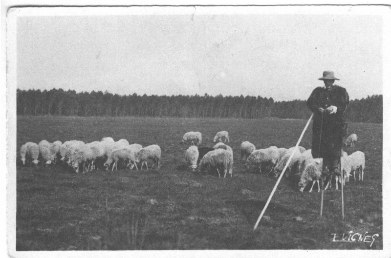
Schafhirt auf Stelzen, Frankreich, ohne Jahr.

Der Schafhändler heisst Herr Fritschi, er wohnt in einem der Dörfer am See. Muss ein Schaf geschlachtet werden, dann holt er es ab. Von Zeit zu Zeit bringt er uns einen jungen Bock und nimmt den alten in Zahlung dafür. Die Lämmer züchten wir selber.