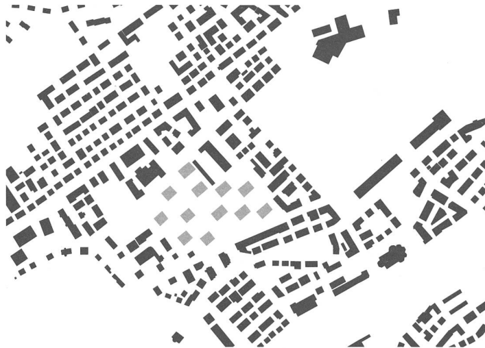
Ausschnitt Stadtplan Quartier Lachen, St. Gallen, 1:10 000

nicht auch an den Prozess des Weiterbauens in Pontresina, wie er im Artikel «Die Kunst des Austarierens» von Marina Hämmerle eindrücklich beschrieben wird?