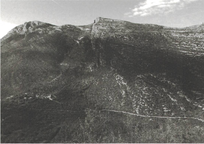
Das Dorf Orahov Do nahe an der Grenze zu Kroatien.