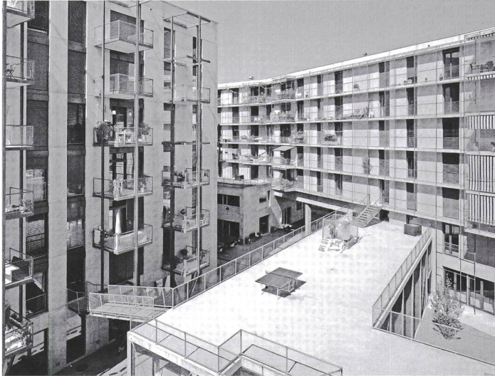
Überbauung des Zwicky-Areal

«Umsicht – Regards – Sguardi» heisst der Preis, den der Schweizerische Ingenieur- und Architektenverein SIA inzwischen zum vierten Mal vergeben hat. Aus 79 eingereichten Bauten und Landschaftsgestaltungen hat die Jury acht ausgewählt und präsentiert sie in einer Wanderausstellung, die nun im Kulturkonsulat in St.Gallen Halt macht.