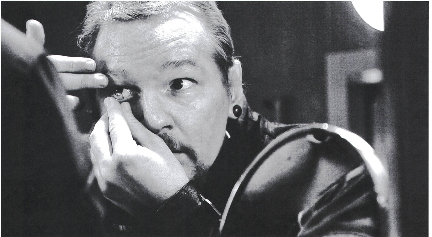
Filmstill aus RISK von Laura Poitras.