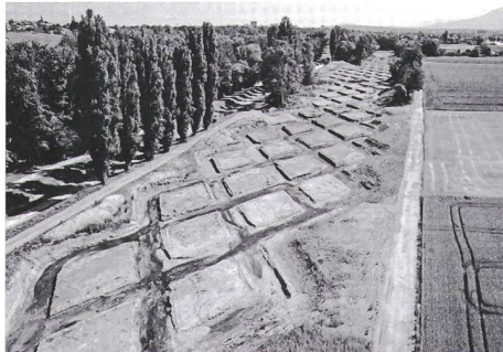
Renaturation Aire

«Umsicht», bis 4. November, Kulturkonsulat, Frongartenstrasse 9, St.Gallen