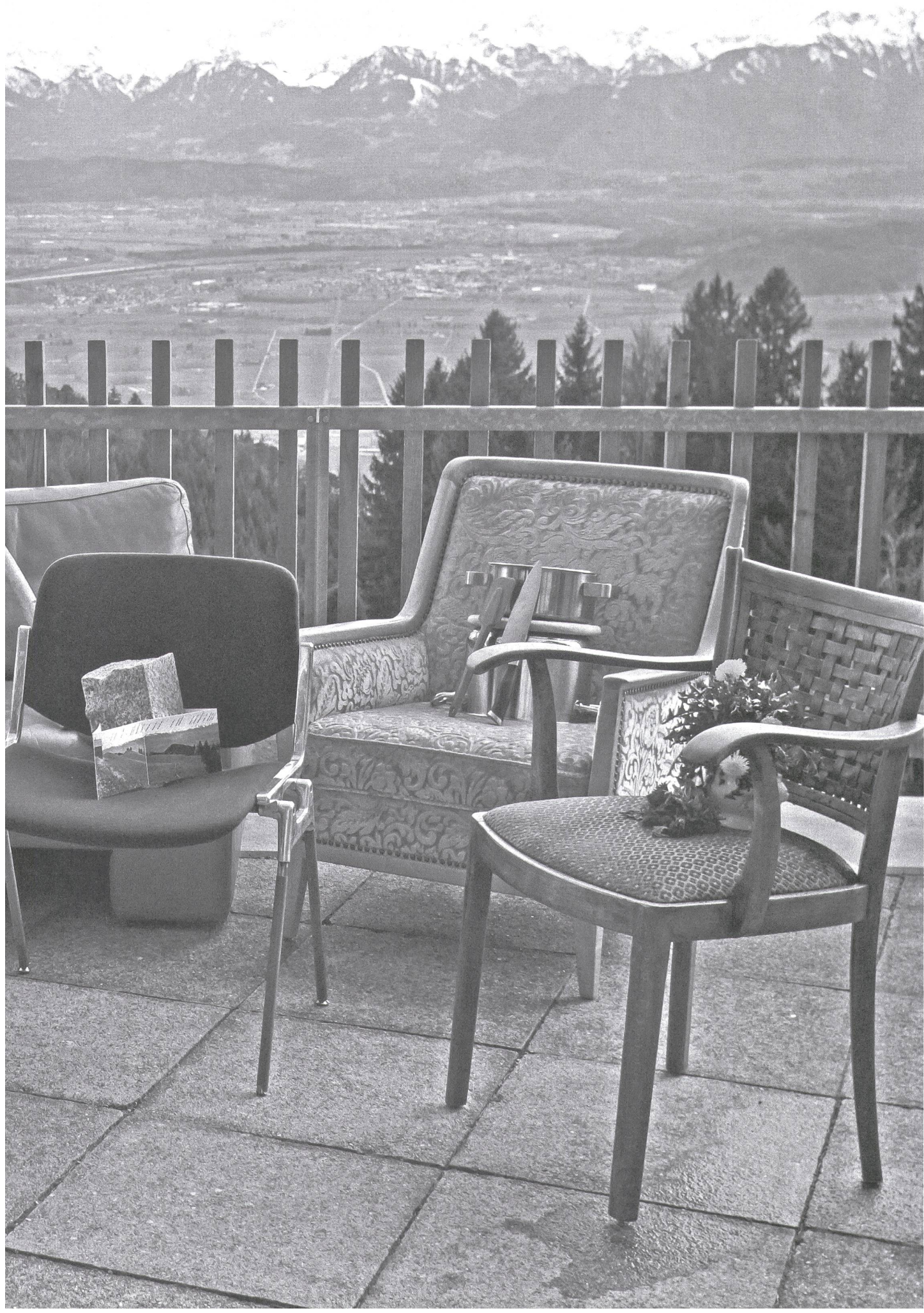
Top 8 things to do in St. Anton (from left to right) : Browse through the 'Bibliothek der Unterhaltung und des Wissens, 1908', read with the wind, local beer tasting, driving zigzag along the mountain road, wandering around, enjoying the panorama, cooking, and foraging wild plants.