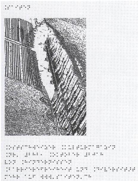
Saiten Nr. 282, Oktober 2018